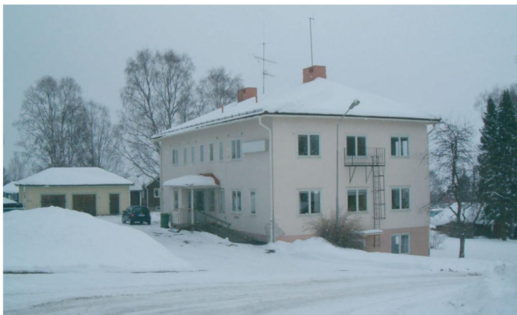
FIGUR 4: Kommunalhuset, senare kommunalskontor, numera med Svenska Kyrkan som hyresgäster, som det tedde sig en vårvinterdag 2006.

som välfärdspolitiskt mål, att bygga bort bostadsbristen och den låga bostadsstandarden, bör dock inte underskattas. Miljonprogrammet bestod till en tredjedel av höghus (kanske de man vanligen förknippar med begreppet), en tredjedel lägre flerfamiljshus och en tredjedel småhus (Ramberg 2000:145). Det är i första hand de lägre flerfamiljshusen som är aktuella för rivningar i de små tätorterna. Med andra ord är det inte i första hand de områden som förknippas med förortens ”poesi” som är aktuella i vårt fall (se t.ex. Ericsson & Ristilampi 2002). Det är en annan sida av miljonprogrammet som möter oss i orter som Gällö och Svenstavik.