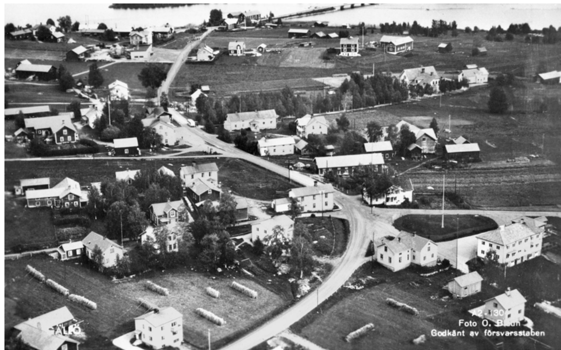
FIGUR 3: Det som numera utgör Gällös centrala delar med skola, Folkets hus och affär hade en annan karaktär på 1950-talet. Delar av gårdsbilden i mitten finns kvar i hembygdsföreningens ägo och bildar en egen "ö" bland dessa moderna byggnader. På bilden har byn ännu karaktär av bondby, men kommunalhuset i nedre högra hörnet skvallrar om nya ambitioner.

Drygt hälften av de hyreshus som rivits i Sverige under nämnda period har kommit till inom miljonprogrammet (Nilsson 2000:44). Miljonprogrammet kom sig av ett löfte från regeringen att en miljon nya bostäder skulle byggas mellan åren 1965 och 1975, vilket föranledde en intensiv takt i byggandet och gav ett resultat som kritiserats för att vara präglad av dålig kvalitet och ett försummande av estetiska värden till fördel för rationella, funktionella och tekniska aspekter. Dess betydelse