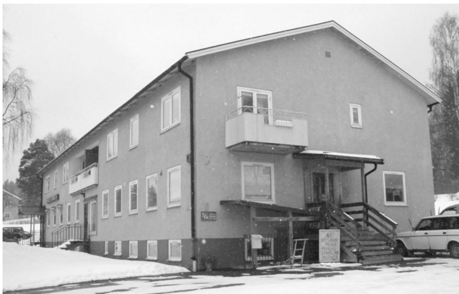
FIGUR 6: Ett av de stiftelsehus som byggdes på 1950-talet i Gällö, fortfarande inrymmande bank och en diverseaffär. Längre bort skymtar ett tomrum bakom parkeringen, där en för tunnning av detta tidiga centrum ägt rum genom en rivning. Gaveln på det tredje huset i den ursprungliga trilogin på Revsundsvägen 28 skymtar.

Att resurserna inte ens togs tillvara i form av återvinning vid de första rivningarna, utan att allt blev schaktmassor, är också ett argument i den här kriti-