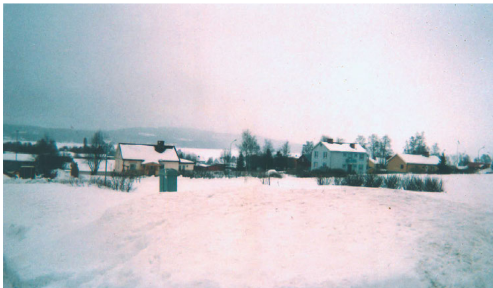
FIGUR 8: "Utsikt från hyreshuset", engångskamera och rubricering använd av ung hyresgäst. Rivningsytan bildar ett glapp mellan miljonprogramsområdet och den äldre villabebyggelsen. I det blå huset bodde tidigare två andra hyresgäster på Mellanvägen, ett syskonpar som då delade huset med sin mor och kvinnans man och som nu delar en trea med egen ingång (fältdagbok M. Andersson). I skrivande stund planeras ett bygge av ett nytt ålderdomshem här på Mellanvägen, troligen mitt i glappet.

Till att börja med föddes själva tanken om ett kulturarv som ett svar på det hot som industrialismen ansågs utgöra mot "äldre" kulturformer. Att överhuvudtaget betrakta industrisamhället som ett kulturarv bär alltså med sig en historisk paradox (Anshelm 1993, Aronson 2005, Beckman 2005: 146). Det intensiva intresse som till en början ägna-