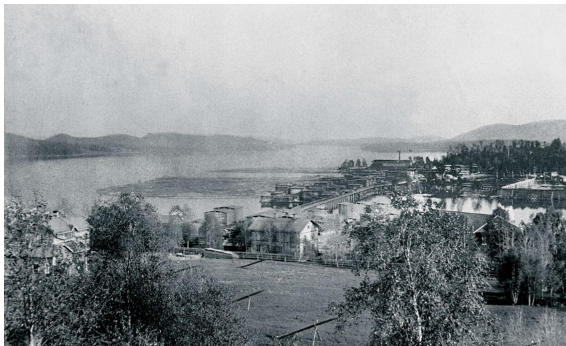
FIGUR 1: I området runt sågverket på Ön (som var en ö innan sågverket anlades och band ihop den med fastlandet) fanns tidigare kaserner för sågverksarbetarna. På det här fotot från 1912 syns också ett parti av Gällö som fortfarande hade karaktären av bondby. Uppgifter: Gunnar Bengtsson, Gällö.

Fokus i denna artikel ligger på Gällö, en ort med i dag 700 invånare. Gällö var från början en bondby som kom att präglas av skogsarbete i mycket hög utsträckning, liksom de flesta byar i liknande områden. Orten fick ett uppsving på 1880-talet med järnvägens ankomst och etableringen av sågverket i direkt anslutning till samhället (fig. 1, 2). På 1950-talet byggdes kommunalkontor i samband med kommunreformen 1952 och de första stiftelsehusen uppfördes efter huvudgatan (fig. 3, 4, 6). Ett flertal affärer och rörelser startade under samma tid. 1960-talet och början av 1970-talet präglades av ytterligare expansion med flera hyreshusbyggen och en ny skola. Villabygget har också satt tydliga spår i Gällös bebyggelse under den här tiden,